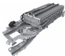
ハイブリッド駆動バッテリー