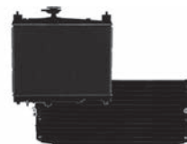
ラジエーター・コンデンサー