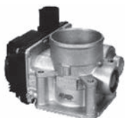
電子制御スロットルボディ