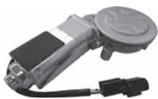
パワーウィンドウモーター