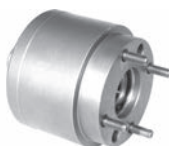
ビスカスカップリング