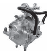
ペーパーライザー トヨタ・コンフォートのみ