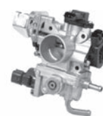
スロットルチャンバー