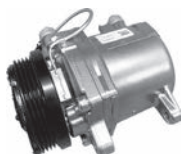
エアコンコンプレッサー