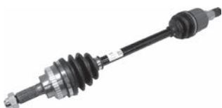
ドライブシャフト