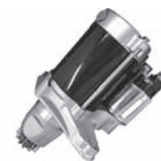
スターターモーター