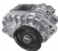
スーパーチャージャー