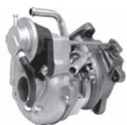
ターボチャージャー